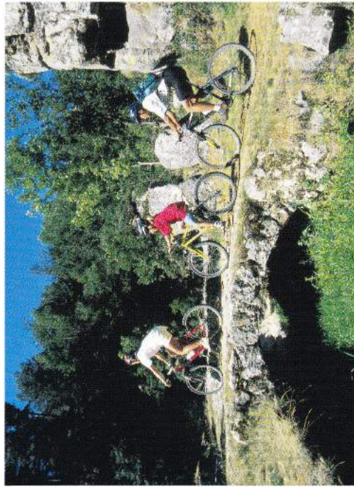
Passerelle sur l'Arzon à Chomelix Bas

Sans oublier sur le circuit n° 4 la très belle maison d'assemblée dominant le joli village des Boudoux en surplomb de la Chamalières (rivière de première catégorie), ainsi que le four à pain de Sentenac . Sur le circuit n° 3, vous pourrez visiter le four à pain de Sassac et du Breuil .